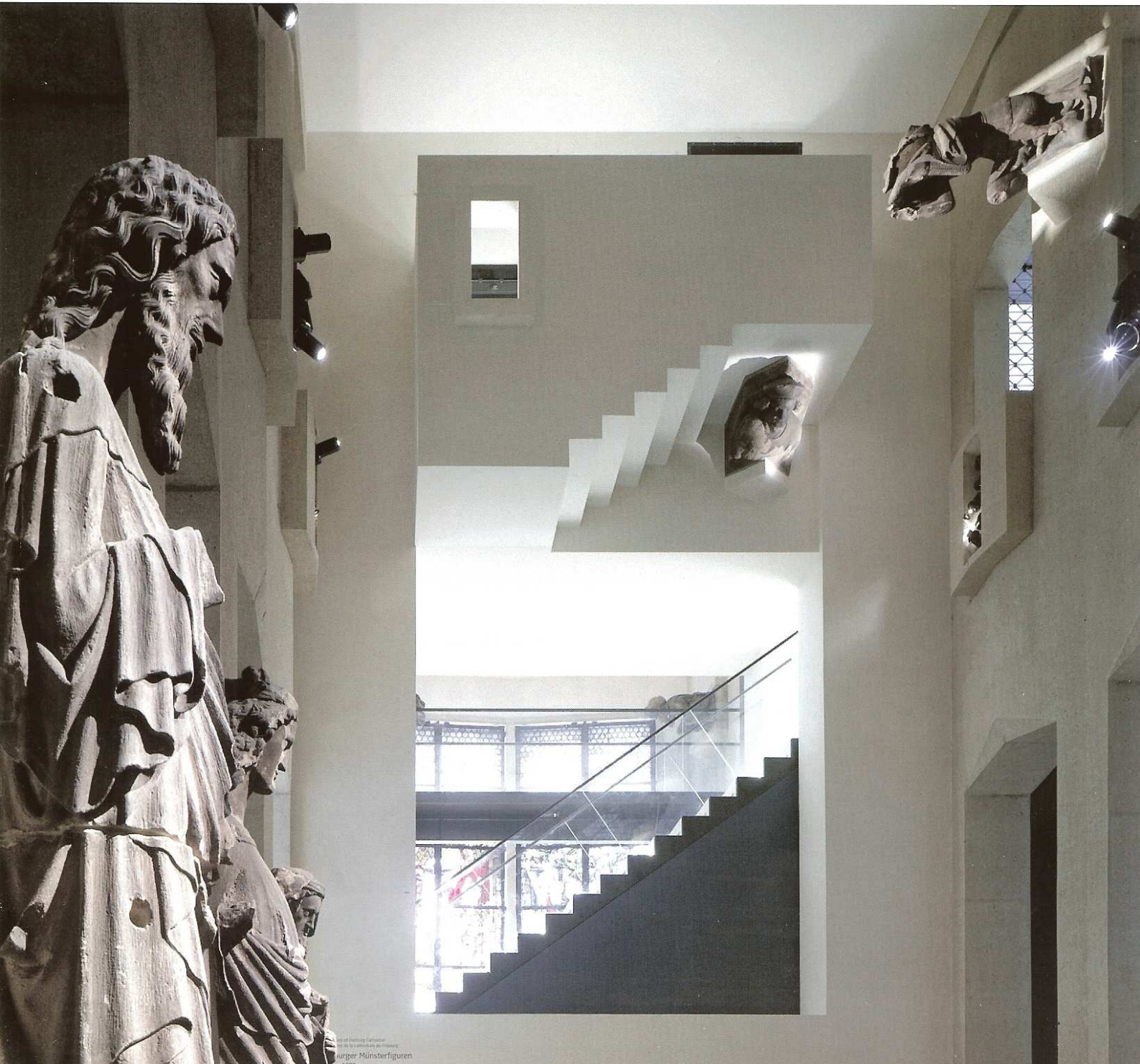
© 2010 Hellmuth Obata Kasper Architekten Münsterfiguren