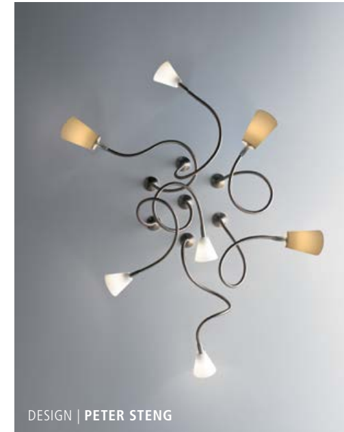
DESIGN | PETER STENG

LED HALO 12 V | max. 35 W | QT-LP9/12 & QR-CBC-35 Ohne Leuchtmittel | Lamp not included