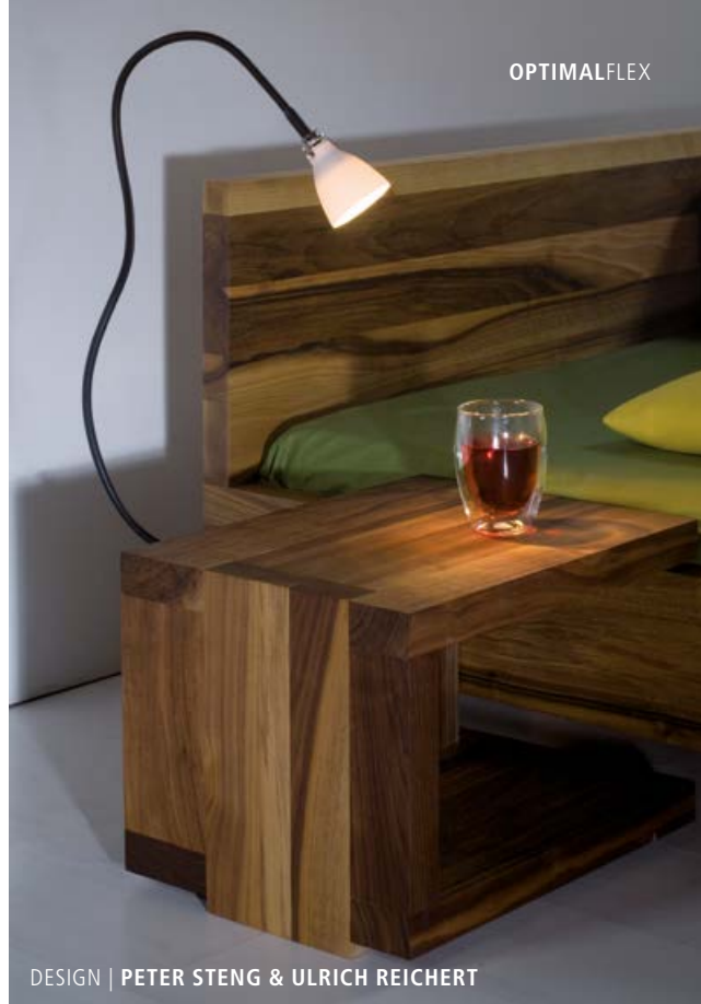
DESIGN | PETER STENG & ULRICH REICHERT

All FLEX versions are equipped with a STENG jack that is adapted to a basic element (pages 90 – 99). Fixed versions without the plug-in connector are available on request for special projects. Lengths over 400 mm are not always suitable for wall installation.