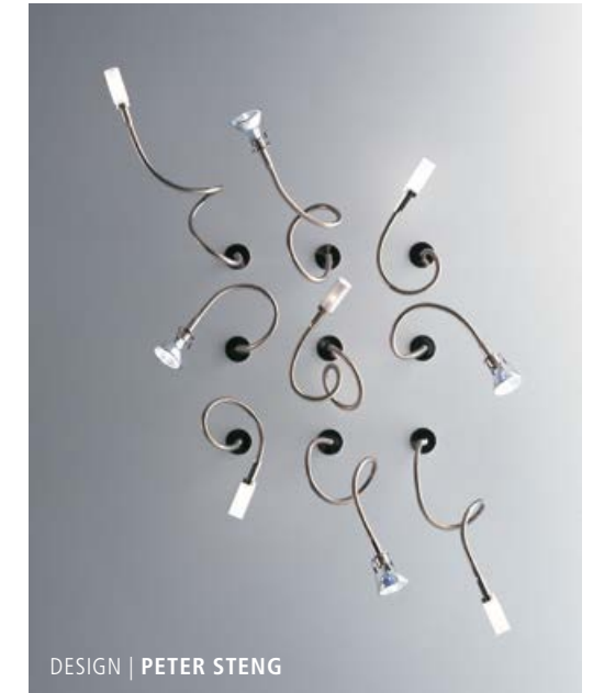
DESIGN | PETER STENG

TOPFLEX LED 12 V | 410 Lm | 7,5 W | 2700 K | CRI 95 Inklusive dimmbarer SORAA Premium Retro-Fit LED Includes a dimmable SORAA Premium Retro-Fit LED